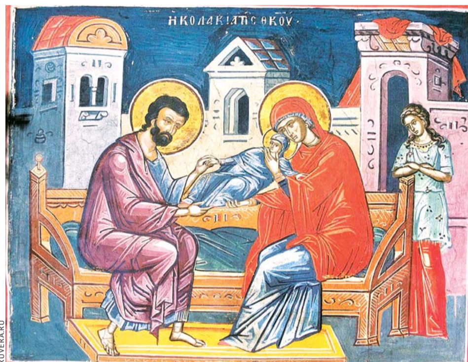
СВЯТЫЕ ИОАКИМ И АННА. ФРЕСКА ИЗ МОНАСТЫРЯ ДИОНИСИЯТ НА АФОНЕ

Кондак, глас тот же: Иоаким и Анна освободились от поношения за бездетность, а Адам и Ева — от смертной гибели святым Твоим Рождением, Пречистой. Его празднуют и люди Твои, избавившиеся от тяготы греховной, громко Тебе восклицая: неплодная рождает Богородицу и питательницу Жизни нашей.