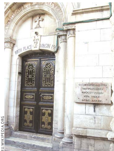
ВХОД В МОНАСТЫРЬ СВЯТОЙ АННЫ, НАХОДЯЩИЙСЯ, ПО ПРАВОСЛАВНОМУ ПРЕДАНИЮ, НА МЕСТЕ ДОМА СВЯТЫХ ИОАКИМА И АННЫ, В КОТОРОМ РОДИЛАСЬ БОГОРОДИЦА. СТАРЫЙ ГОРОД ИЕРУСАЛИМА