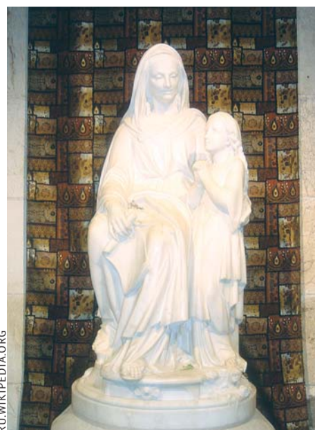
СВЯТАЯ АННА С ДЕВОЙ МАРИЕЙ. СТАТУА В БАЗИЛИКЕ СВЯТОЙ АННЫ, ПОСТРОЕННОЙ, ПО КАТОЛИЧЕСКОМУ ПРЕДАНИЮ, НА МЕСТЕ ДОМА ИОАКИМА И АННЫ. СТАРЫЙ ГОРОД ИЕРУСАЛИМА

К сожалению, как много теперь находится людей, которые смотрят на жизнь с другой стороны, говорят: «Жизнь дана на радость, на наслаждения: бери от неё как можно больше!» Так сами они стараются жить и так учат других жить. Но всмотритесь, сама жизнь показывает, что она даёт не одни радости, а и страдания. И чем больше люди стремятся к радостям и наслаждениям, тем более и более скор-