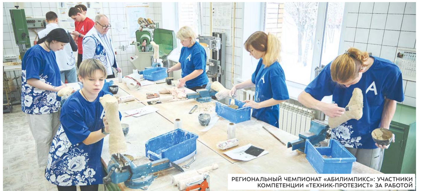
РЕГИОНАЛЬНЫЙ ЧЕМПИОНАТ «АБИЛИМПИКС»: УЧАСТНИКИ КОМПЕТЕНЦИИ «ТЕХНИК-ПРОТЕЗИСТ» ЗА РАБОТОЙ

НАДЕЖДА ЗВЯГИНЦЕВА, ФОТО ИЗ АРХИВА КОЛЛЕДЖА КОСМИЧЕСКОГО МАШИНОСТРОЕНИЯ И ТЕХНОЛОГИЙ ТЕХНОЛОГИЧЕСКОГО УНИВЕРСИТЕТА ИМ. А.А. ЛЕОНОВА