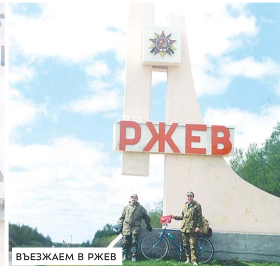
ВЪЕЗЖАЕМ В РЖЕВ