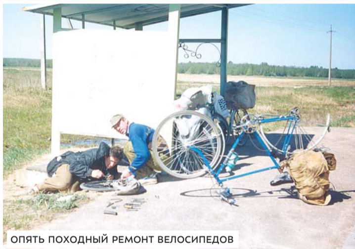
ОПЯТЬ ПОХОДНЫЙ РЕМОНТ ВЕЛОСИПЕДОВ