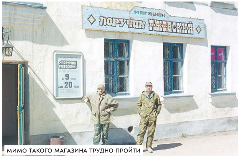
МИМО ТАКОГО МАГАЗИНА ТРУДНО ПРОЙТИ