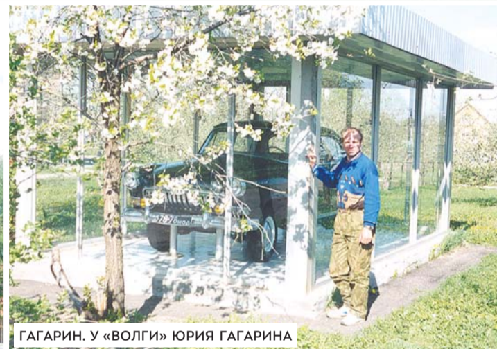
ГАГАРИН. У «ВОЛГИ» ЮРИЯ ГАГАРИНА