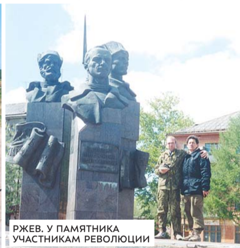
РЖЕВ. У ПАМЯТНИКА УЧАСТНИКАМ РЕВОЛЮЦИИ