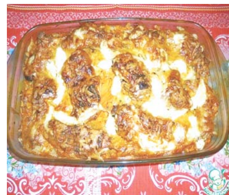
Рис — 400 г Бедро куриное — 6 шт. Лук репчатый — 3 шт. Морковь — 3 шт. Кефир — 1 стакан Сыр твёрдый — 200 г Соль — 1 ч. л. Специи — 2 ч. л. Масло подсолнечное — 2 ст. л. Вода — 400 мл

Выложить курицу на овощи. Сверху насыпать любимые специи. Налить в блюдо 2 стакана горячей подсолёной воды.