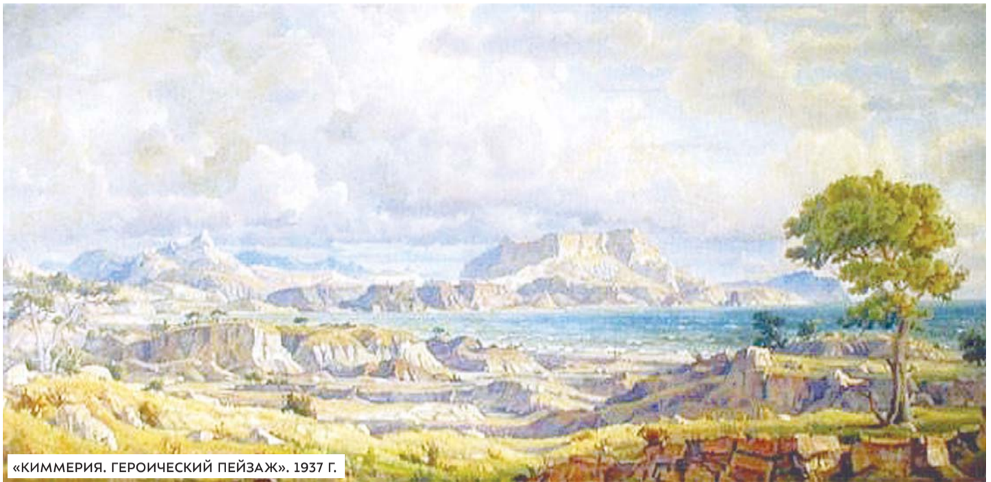
«КИММЕРИЯ. ГЕРОИЧЕСКИЙ ПЕЙЗАЖ». 1937 Г.

Музей, созданный в 1988 году, может гордиться собранием своих живописных полотен. Среди них работы И.К. Айвазовского, И.И. Шишкина, В.Д. Поленова, М.И. Кустодиева, В.А. Серова и других знаменитых мастеров.