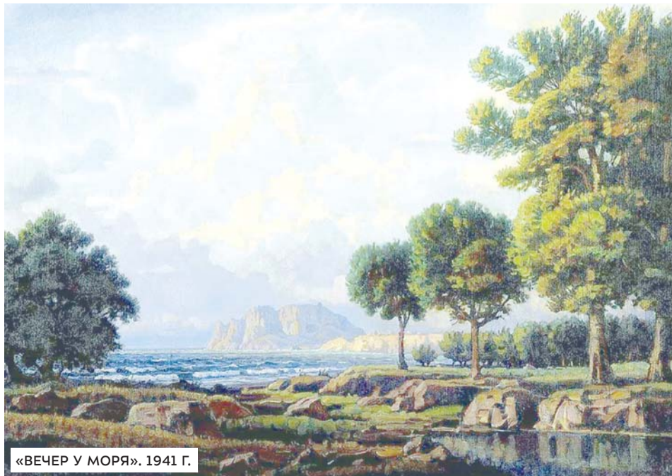
«ВЕЧЕР У МОРЯ». 1941 Г.