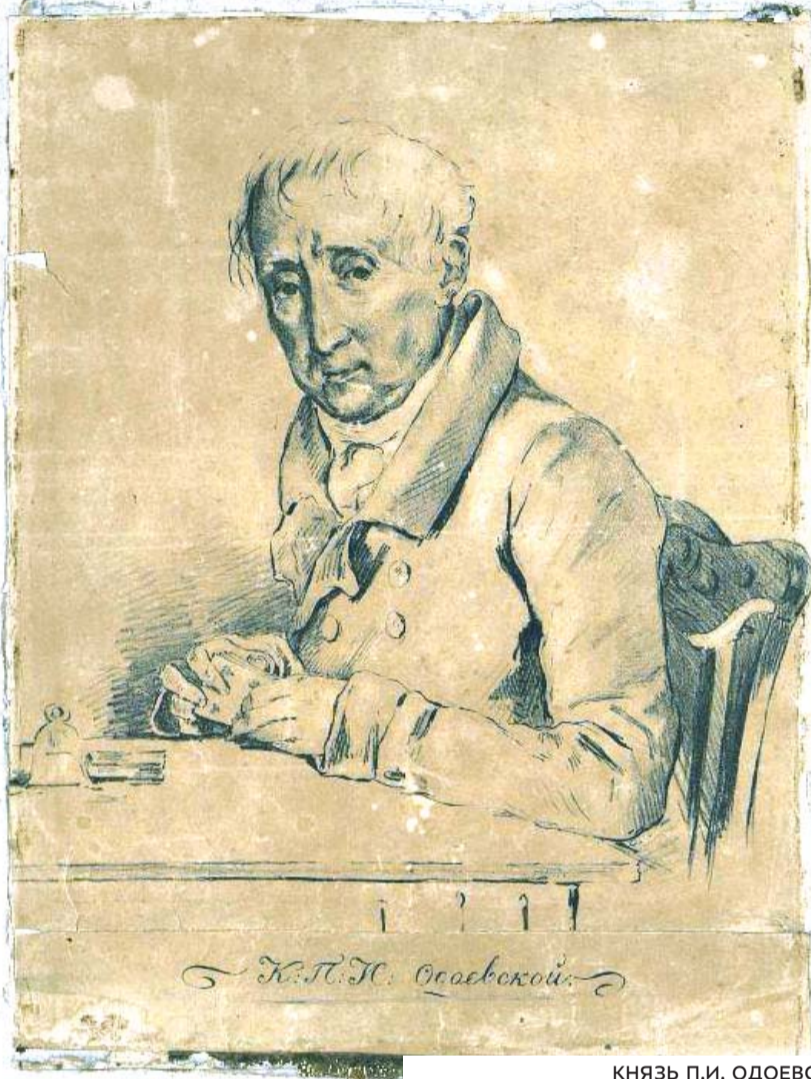
князь П.И. ОДОЕВСКИЙ. ЛИТОГРАФИЯ, ПЕРВАЯ ПОЛОВИНА XIX В. ГОСУДАРСТВЕННЫЙ ИСТОРИЧЕСКИЙ МУЗЕЙ

Владел многочисленными поместьями в разных губерниях, в том числе селом Болшево с деревнями в Московской губернии и уезде (ныне микрорайон г. Королёва Московской области), а также несколькими домами в Москве.