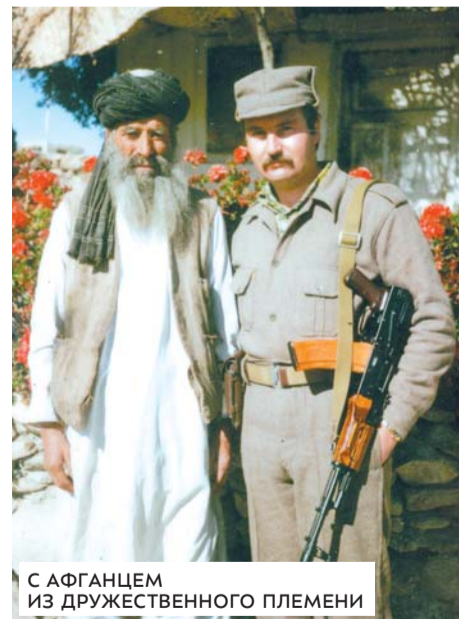
С АФГАНЦЕМ ИЗ ДРУЖЕСТВЕННОГО ПЛЕМЕНИ

– Две недели рота в боях без отдыха. Нам даже негде и некогда умыться, постирать одежду. Командование как будто забыло о нас. Даже в пятницу заставляют воевать... (у мусульман пятница – святой день).