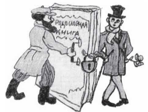
КУПЕЦ ВО ДВОРЯНСТВЕ. ШАРЖ НА КУПЦА-ПРОМЫШЛЕННИКА, ПРОБИВАВШЕГОСЯ В ДВОРЯНСКОЕ СОСЛОВИЕ