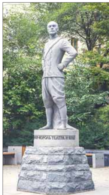
Памятник Юлу Бриннеру.

Много любопытных памятников. Сохранились триумфальные ворота в честь посещения города цесаревичем Николаем – будущим императором России; памятник графу Муравьёву-Амурскому, во многом благодаря которому, по результатам переговоров с китайцами, России отошли зем-