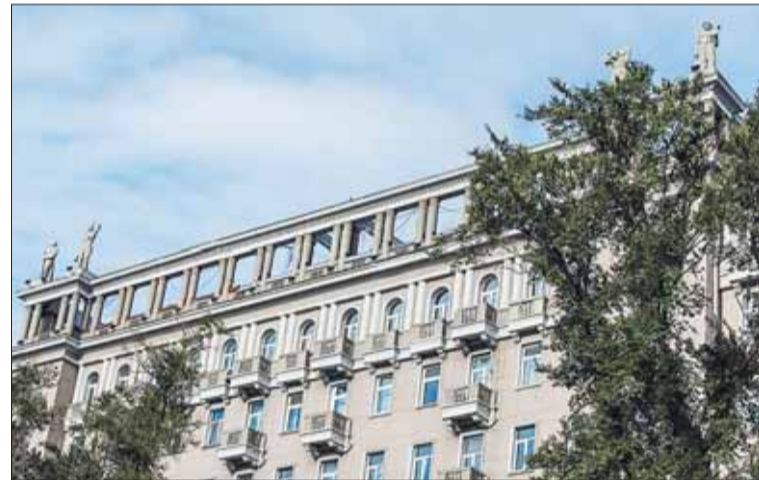
Дом «Серая лошадь».

птуры – лётчика, красноармейца, шахтёра и колхозницы, но скульптуры лошади нет ни на крыше, ни возле дома. Как выяснилось уже после возвращения из поездки, наиболее вероятной считается следующая версия. Название дому да-