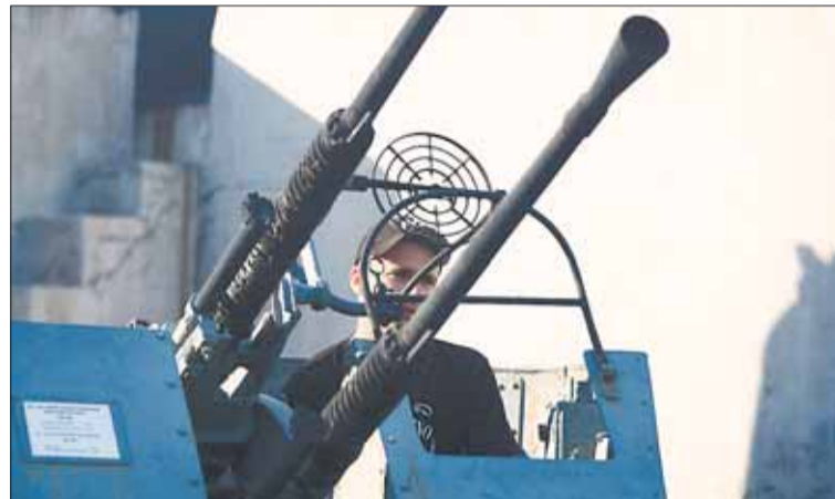
Во Владивостокской крепости.

Много гуляющего народа, что характерно для больших портовых городов. Среди ту-