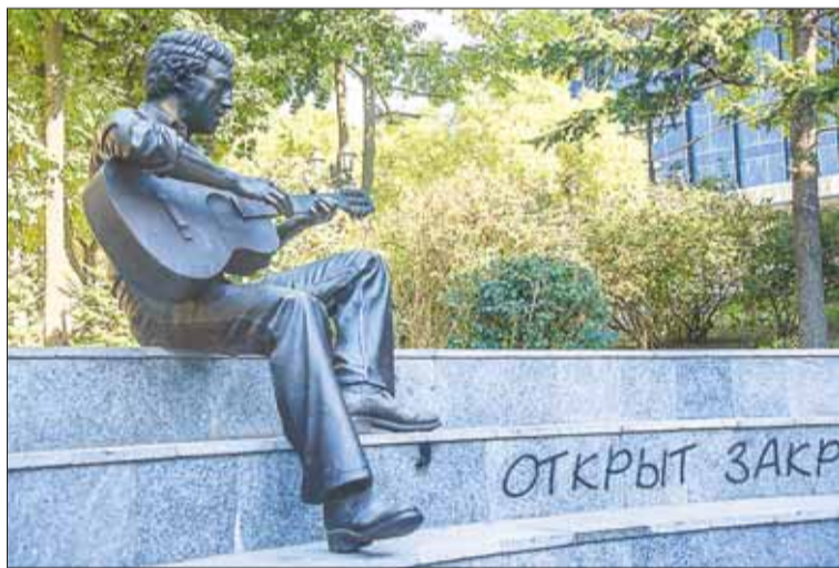
Памятник Владимиру Высоцкому.

всегда идёт и при хорошей погоде дожидается, пока грузовые машины заполнят трюм. Кроме того, отсутствуют рейсы самолётов из Комсомольска-на-Амуре на Сахалин, так что добираться туда нужно было из Хабаровска. В результате маршрут упростился, но поскольку хотелось сохранить длительность поездки в три недели, появилась возможность задержаться в интересных местах подольше и иметь возможности для манёвра.