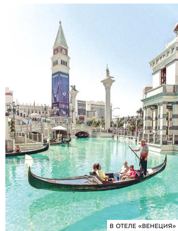
В ОТЕЛЕ «ВЕНЕЦИЯ»

Самым большим отелем Лас-Вегаса является отель «Венеция», а вместе с соседним Palazzo этот гостиничный комплекс является и крупнейшим в мире – более 17 тысяч номеров. И чего только нет в отеле «Венеция»: