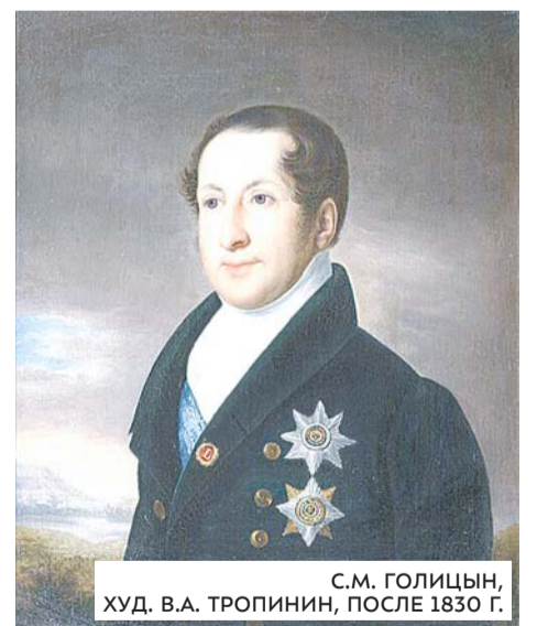
С.М. ГОЛИЦЫН, ХУД. В.А. ТРОПИНИН, ПОСЛЕ 1830 Г.

«Маленький, худенький, бледный сенатор, страстный охотник до картин и новостей, который, как говаривал Граф Ростопчин, всему на свете верил и всего на свете боялся».