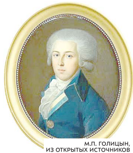
М.П. ГОЛИЦЫН

Такое описание московских старожил очень созвучно описанию современниками и самого П.И. Одоевского.