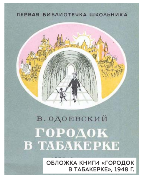
ОБЛОЖКА КНИГИ «ГОРОДОК В ТАБАКЕРКЕ», 1948 Г.