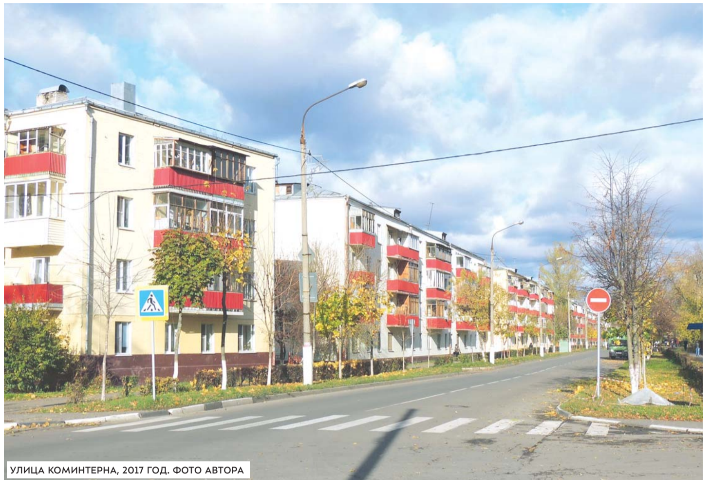
УЛИЦА КОМИНТЕРНА, 2017 ГОД.

Однако частично — по крайней мере, за период 1927—1934 годов — протоколы сохранились, и, к счастью, именно в них нашлась искомая информация.