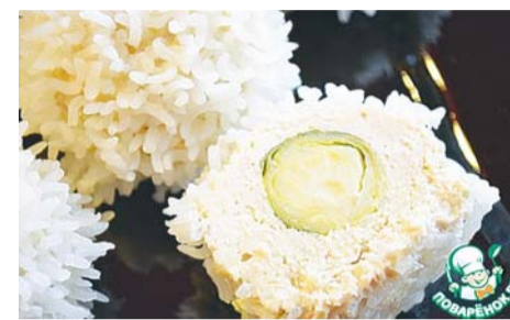
Рис басмати или жасмин заранее замочить в холодной воде на 1–2 часа, выложить на полотенце и просушить. В фарш добавить яйцо, соль и специи и хорошо перемешать. Фарш формируем

в тефтелю, внутрь которой заворачиваем начинку-сюрприз.