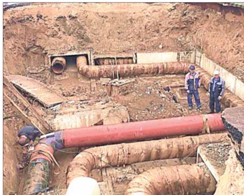
Устранение аварии на магистральной тепловой сети горячего водоснабжения.