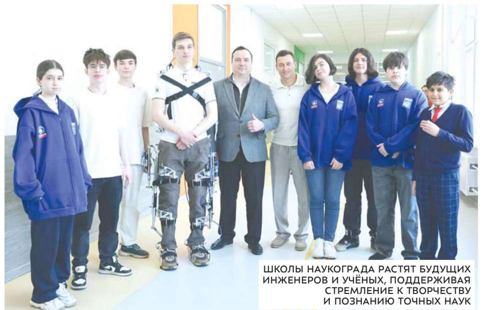
ШКОЛЫ НАУКОГРАДА РАСТЯТ БУДУЩИХ ИНЖЕНЕРОВ И УЧЁНЫХ, ПОДДЕРЖИВАЯ СТРЕМЛЕНИЕ К ТВОРЧЕСТВУ И ПОЗНАНИЮ ТОЧНЫХ НАУК