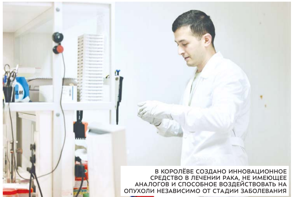
В КОРОЛЁВЕ СОЗДАНО ИННОВАЦИОННОЕ СРЕДСТВО В ЛЕЧЕНИИ РАКА, НЕ ИМЕЮЩЕЕ АНАЛОГОВ И СПОСОБНОЕ ВОЗДЕЙСТВОВАТЬ НА ОПУХОЛИ НЕЗАВИСИМО ОТ СТАДИИ ЗАБОЛЕВАНИЯ

Поддержка бизнеса, запуск современных производств и создание рабочих мест остаются одними из ключевых направлений Народной программы «Единой России».