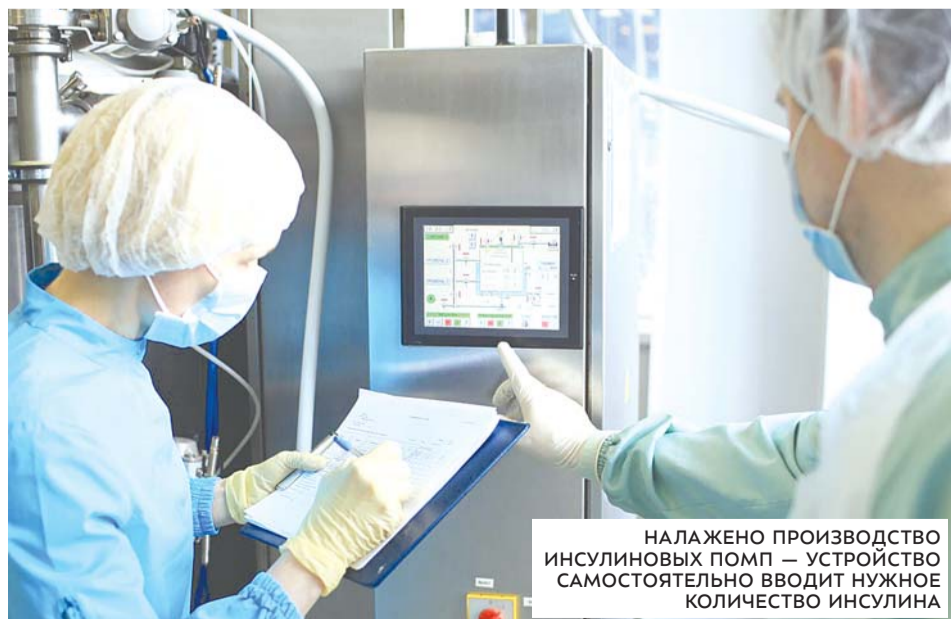
НАЛАЖЕНО ПРОИЗВОДСТВО ИНСУЛИНОВЫХ ПОМП — УСТРОЙСТВО САМОСТОЯТЕЛЬНО ВВОДИТ НУЖНОЕ КОЛИЧЕСТВО ИНСУЛИНА