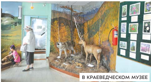
В КРАЕВЕДЧЕСКОМ МУЗЕЕ