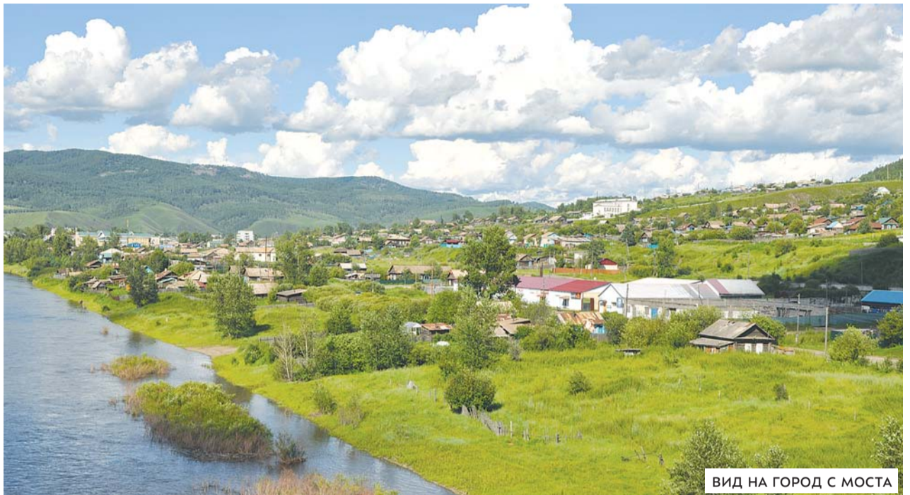
ВИД НА ГОРОД С МОСТА