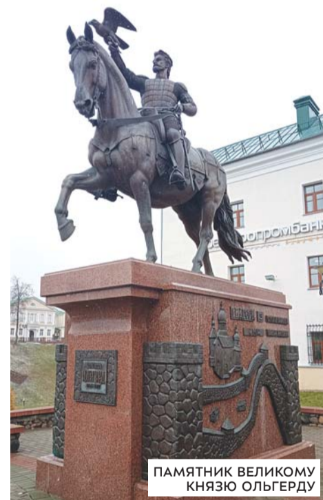
ПАМЯТНИК ВЕЛИКОМУ КНЯЗЮ ОЛЬГЕРДУ