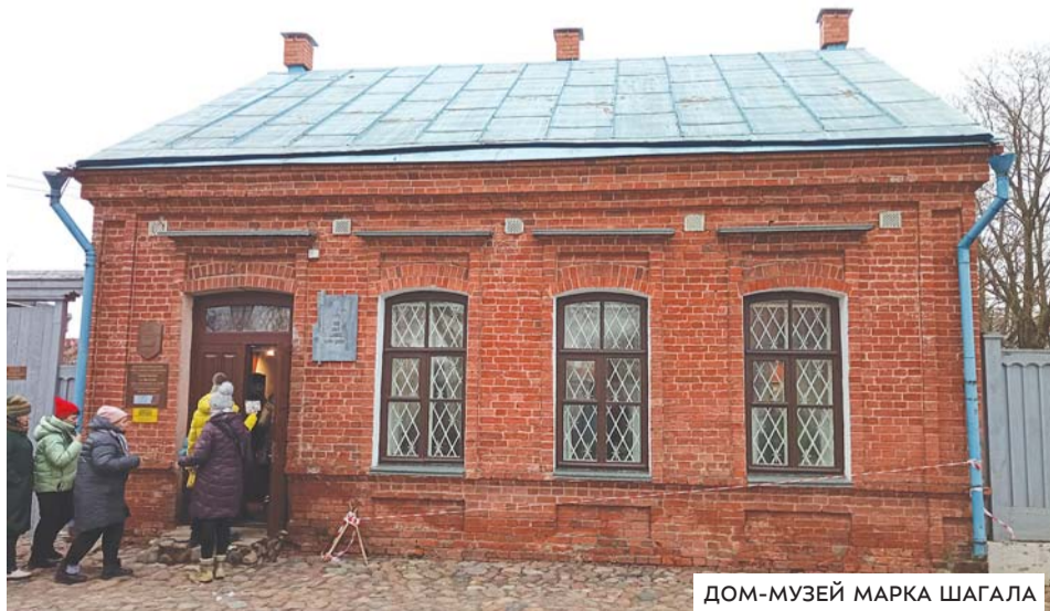
ДОМ-МУЗЕЙ МАРКА ШАГАЛА