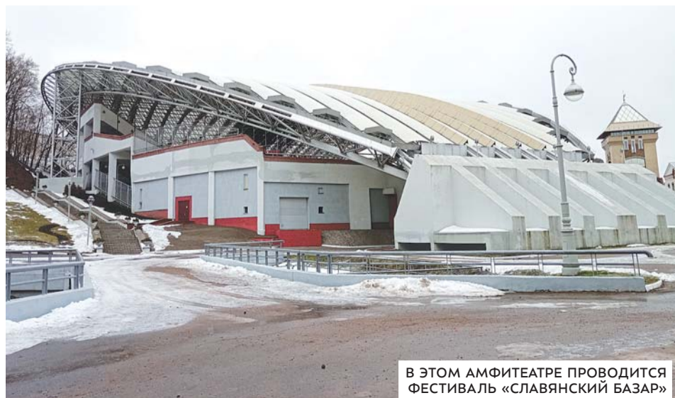
В ЭТОМ АМФИТЕАТРЕ ПРОВОДИТСЯ ФЕСТИВАЛЬ «СЛАВЯНСКИЙ БАЗАР»