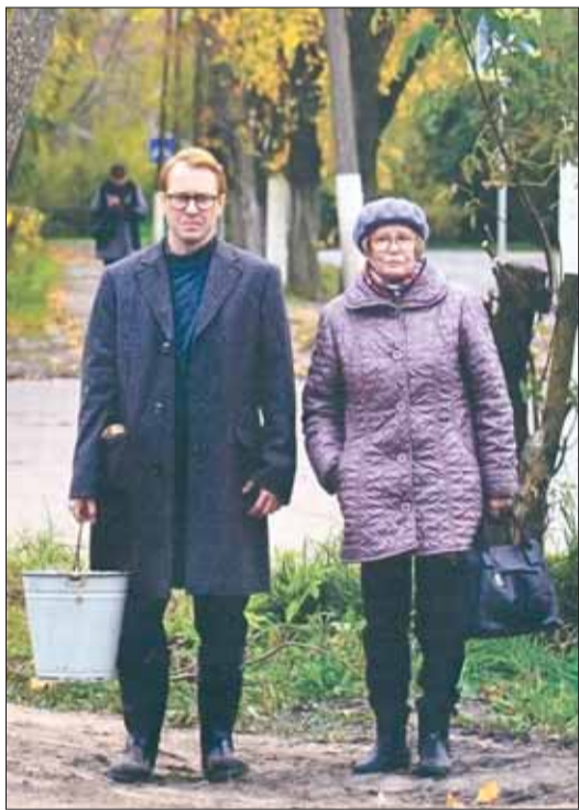
Кадр из фильма «Карп отмороженный».

бражение, неограниченное рамками кинокадра, и самостоятельно выбирать для себя поле зрения и момент действия. Зритель становится действующим сотворцом картины, VR-кино уже стало участником мировых кинофестивалей. В России впервые новинку испытали как на прессе и профессионалах, так и на обычных зрителях.