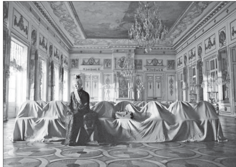
Кадр из фильма «Мешок без дна».

Кинорежиссёр и художественный руководитель театра «Модерн» Юрий Грымов, представивший на 39-м ММКФ свой фильм «Три сестры» заявляет, что в наши дни нет такого понятия, как «русский кинорежиссёр». Это произошло из-за отсутствия преемственности поколений мастеров кино и режиссёров новой волны. Были разрушены студии, но не возникли мастерские мэтров кино, таких как Абдрашитов, Мотыль, Герман-старший, Бондарчук.