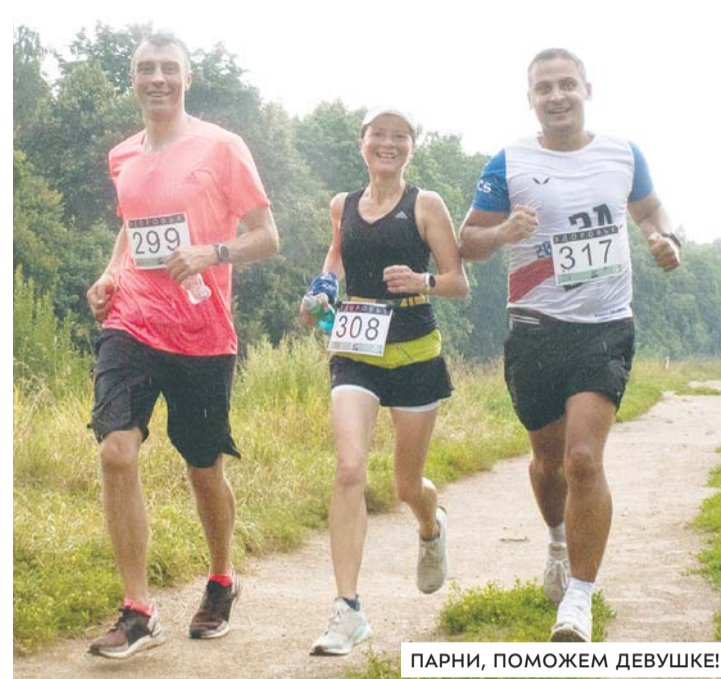
ПАРНИ, ПОМОЖЕМ ДЕВУШКЕ!