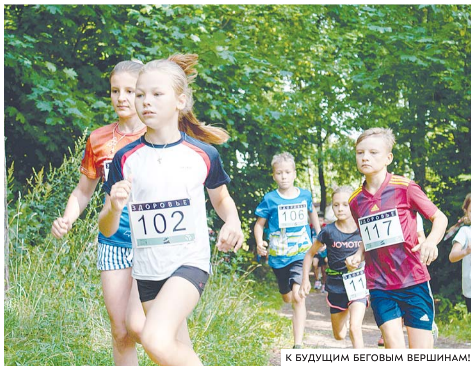
К БУДУЩИМ БЕГОВЫМ ВЕРШИНАМ!