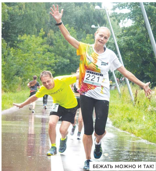
БЕЖАТЬ МОЖНО И ТАК!